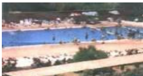
Figure 1:Ain Salama